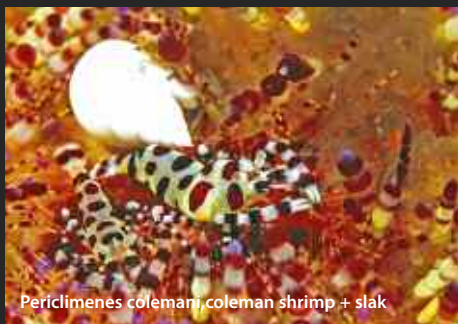
Periclimenes colemani, coleman shrimp + slak

HAARSTERREN Haarsterren zijn ook gastheer van allerlei crustacea, zoals garnaaltjes en krabbetjes, die voelen zich veilig tussen de plakkerige tentakels. Het huisrif van Bahura is een waar eldorado van kleine beestjes! Op het zweepkoraal zitten vaak kleine visjes en garnaaltjes. De iets grotere symbiosegarnaal (periclimenes magnificus) is wel 2,5 cm groot en