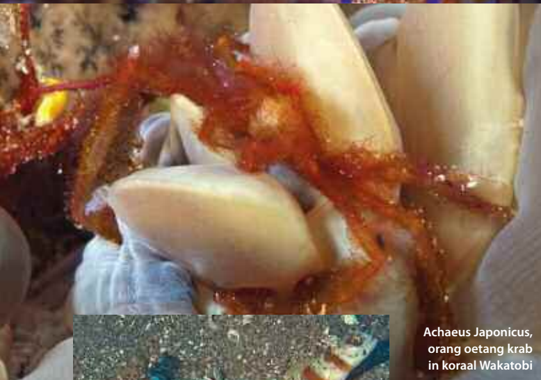
Achaeus Japonicus, orang oetang krab in koraal Wakatobi