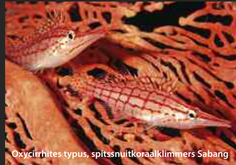
Oxycirrhites typus, spitsnuitkoraalklimmers Sabang