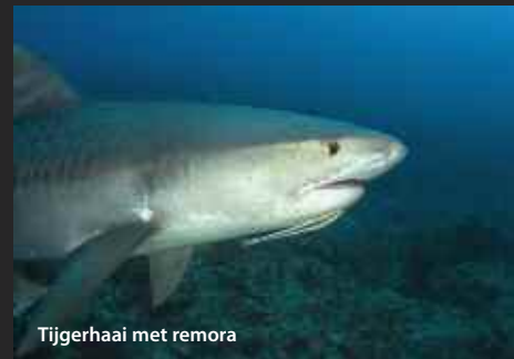
Tijgerhaai met remora