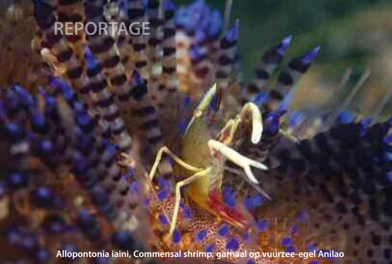
Alloponotonia iaini, Commensal shrimp, garnaal op vuurzee-eegel Anilao